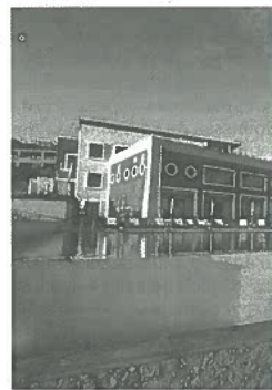
Hotel está fechado desde 2010

A publicação recorda ainda que o Hotel Terra do Mar abriu em 2008, após um investimento de 17 milhões de euros, participados por fundos comunitários, da Azores International Tourism Club Hotel, SA, cuja estrutura era composta por 19 acionistas luso-franceses, de entre os quais os Jean-Louis Magnan e Gilbert Vietto, que idealizaram o projeto, além da HDK, SA, F. Turismo Capital de Risco, SA, e a Construtora Abrantina, SA.